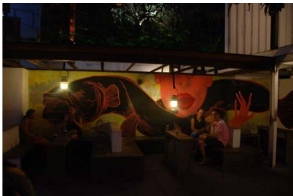
Eine der abendlichen Sitzcken in der Fábrica de Arte Cubano