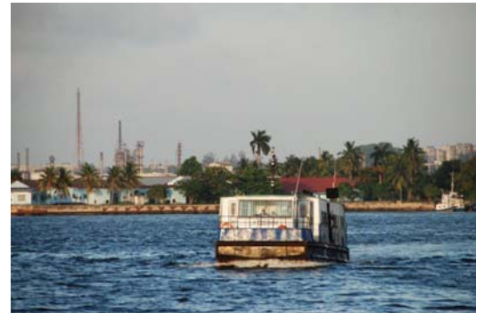
Die Fähre nach Regla auf der anderen Seite der Bucht von La Habana – Industrie unter Palmen