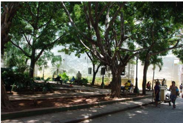
Der kleine Park vor dem Museum und der Innenhof des Museums, das komplett saniert wird.

Ein Beispiel für die Nutzung der alten Bauten ist das Museum für Alexander von Humboldt in dem Haus, in dem er im Winter 1800 / 1801 in La Habana seine botanischen und mineralischen Sammlungen zusammenstellte und an diesen forschte.