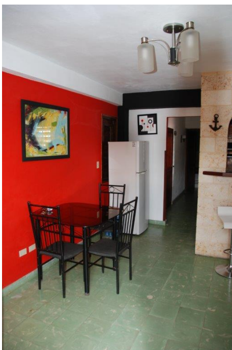
Beispiel für eine als Casa particular vermietete Wohnung in der Altstadt von La Habana – mit Frühstück –

Voraussichtliche Kosten: 3980 Euro (im Doppelzimmer), inklusive Flug, zumindest finanzieller Ausgleich der CO 2 -Emissionen des Fluges über die Umweltorganisation Atmosfair ( www(dot)athmosfair(dot)de ), Übernachtungen in Casas Particulares (Privatunterkünften) in Havanna und bei den Exkursionen teilweise in Hotels, Frühstück, Busfahrten an und zwischen den Stationen der Studienreise, weitere Fahrten, Reiseleitung und Eintrittsgelder, ggf. Einzelzimmerzuschlag ca. 390 € .