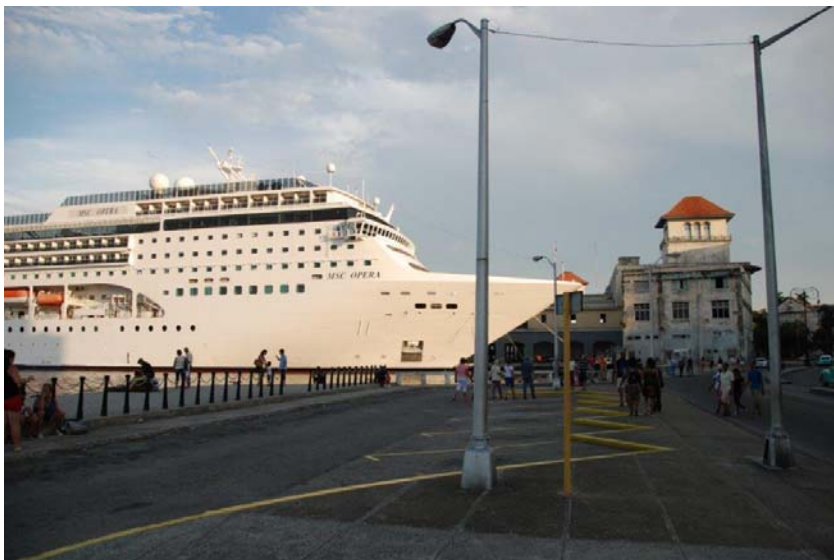
Zwei Welten treffen auf einander: Kreuzfahrtschiff im alten Hafen von La Habana

Welche Strategien verfolgen die Kubaner zum Erhalt der Altstadt von Havanna, das zum Unesco-Weltkulturerbe zählt? Was wird zur Sanierung der Bucht getan, die der Hauptstadt eine einzigartige Lage bietet? Auf dem Programm stehen auch der Schutz der Mangrovenwälder an der Straße von Florida, die für Länder des Südens einzigartige kubanische Bildungs- und Sozialpolitik und der Tourismus als Hauptwirtschaftsfaktor. Wir schauen, inwieweit Akzente einer vorsichtigen Suche nach neuen Wegen in Politik und Wirtschaft erkennbar sind.