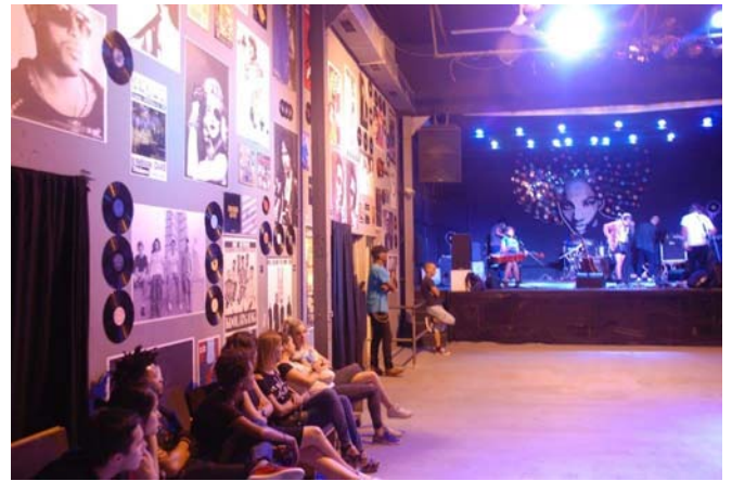
Links oben: Dachterrasse des Hotels Ambos Mundos mit Cocktailbar, Blick über Altstadt, Bucht und Meer