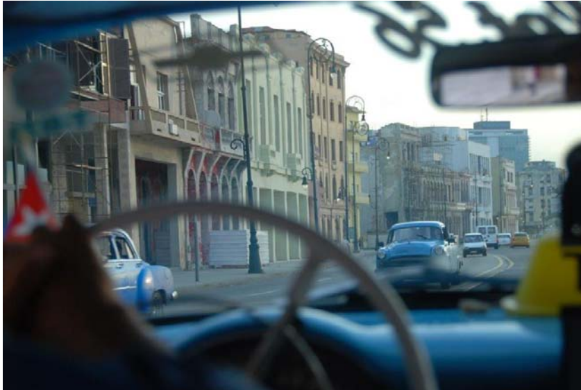
Unterwegs im Taxi aus den fünfziger Jahren auf dem Malecon, der elf Kilometer langen Uferpromenade von La Habana

Unsere Reise soll viele Türen öffnen. Wir wollen mit Vertretern des politischen und wirtschaftlichen Lebens, mit Verwaltungsexperten und Geistlichen ins Gespräch kommen. Wie sieht das kubanische Alltagsleben heute aus? Auf welche Weise ist es mit einer Kultur verbunden, deren Musik oder Filme weit über Lateinamerika hinausstrahlen? Wir wollen erkunden, welche Faktoren die zukünftige Entwicklung Kubas mit beeinflussen werden. Das Eintauchen in ein urbanes Lebensgefühl unter karibischer Sonne und in tropischen Nächten kann uns bei dieser Spurensuche helfen.