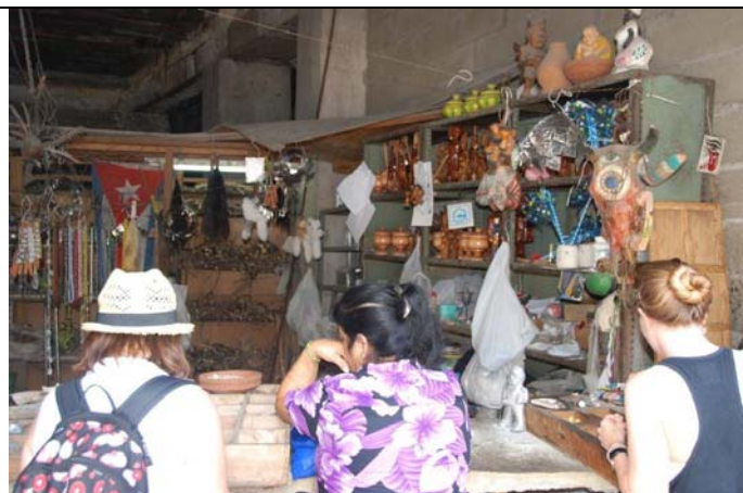
Oben: Verkauf religiöser Gegenstände der Santeria