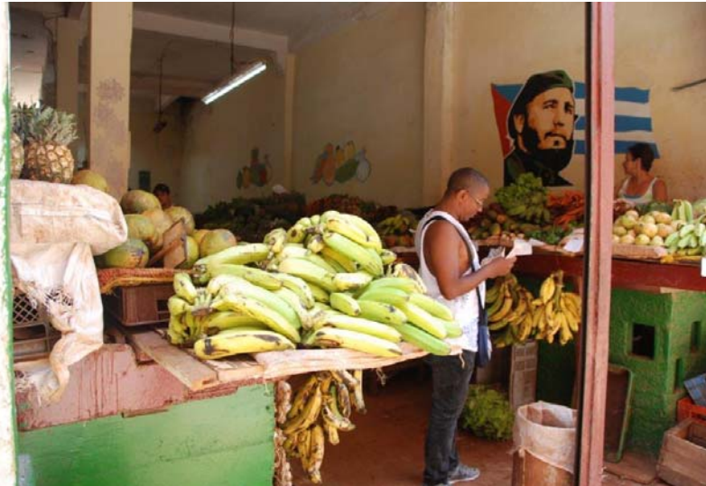
Obst- und Gemüseverkauf mit revolutionärer Begleitung